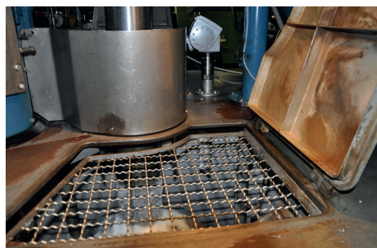
Guide d'onde et miroir de déviation 45°