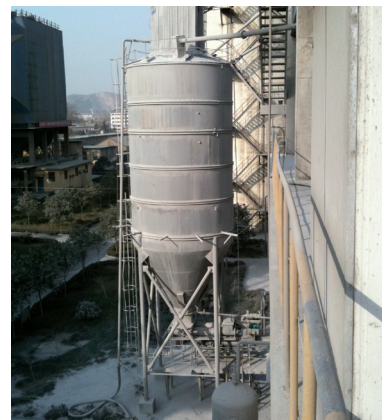
Silo de 9 metros de altura que contiene polvo de cemento

Combinando una alta dinámica de señales con la tecnología de radar FMCW, el OPTIWAVE 6300 C garantiza medidas fiables incluso en atmósferas muy polvorientas. Al contrario que las antenas de bocina tradicionales, su innovadora antena elíptica evita la formación de costra gracias a su forma y a la suavidad de su superficie, con lo que ya no se requieren sistemas de purga y solamente se precisa un mantenimiento mínimo. Gracias al software, que utiliza un algoritmo específico, con OPTIWAVE 6300 C la medida continua de superficies irregulares ya no es un problema. La antena elipsoidal DN 150 tiene un ángulo de radiación más pequeño que la antena elipsoidal DN 80, lo que la hace perfecta para medir superficies irregulares en silos con objetos internos. Debido a su tamaño, la antena elipsoidal DN 150 también es más eficiente con los productos que tienen constantes dieléctricas bajas. Además, el hecho de que un equipo de 2 hilos requiera menos cableado repercute directamente en los costes de instalación y funcionamiento. Todas estas ventajas, combinadas con un precio competitivo, hacen de OPTIWAVE 6300 C una solución rentable y atractiva para el cliente.