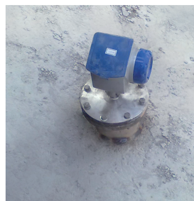
OPTIWAVE 6300 C montado en el techo de un silo