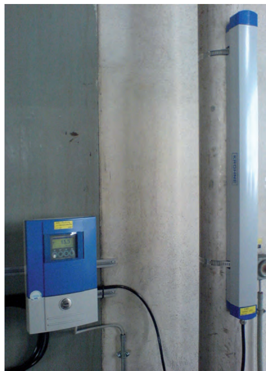
Mesure de débit d'eau déminéralisée avec OPTISONIC 6300

La mesure de débit-volume réalisée par l'OPTISONIC donne une indication de la quantité d'eau déminéralisée à fournir en continu, ce qui permet à l'entreprise chimique de garantir la stabilité de l'approvisionnement en vapeur. Le client dispose désormais de résultats de mesure fiables, sans interruption de process ni ouverture de ligne, car le capteur d'OPTISONIC 6300 est équipé de dispositifs de fixation avec sondes intégrées. Autre avantage pour le client : le débitmètre à ultrasons est facile à installer et ne nécessite aucune formation spécifique. L'entreprise chimique utilise l'OPTISONIC 6300 depuis 2006 sans n'avoir eu besoin d'effectuer de maintenance.