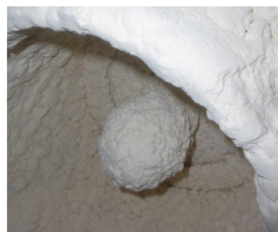
Antenne Drop de l'OPTIWAVE 6300 dans un silo de farine

Avec son radar FMCW 24...26 GHz, l'OPTIWAVE 6300 est conçu pour la mesure de niveau dans l'atmosphère très poussiéreuse de silos de farine. Chaque appareil de mesure est équipé d'une antenne Drop DN 80/3" en PTFE. Afin de pouvoir mesurer le niveau directement depuis le haut, on a mis à contribution, lors du montage, les buses (DN 80/3") existant sur le toit du silo.